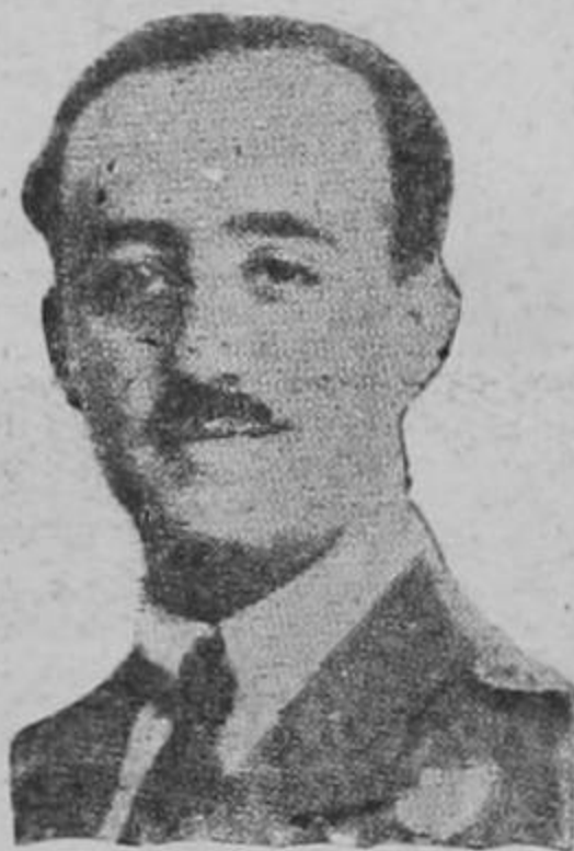
GENERAL FRANCO Quien proclamó hoy la Dictadura Militar en España